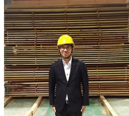
意見交換会で女性の声をいただく 農林水産委員会で視察

障害者週間の啓発事業において、介助犬の紹介イベントを行うなど、積極的に広報活動を実施してきた。今後も普及啓発に努めるとともに育成事業についてもニーズに応じて柔軟に対応していく。