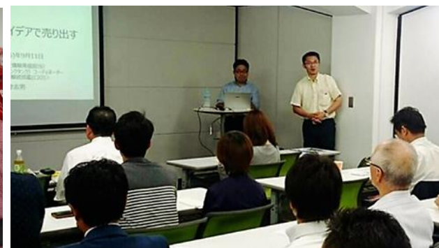
明日の岡山を語る会(勉強会)

中四国地方唯一の小型機専用飛行場の特性を生かすべく、地域の方々や飛行場関係者と連携し、更なるにぎわいの創出を図り、航空関連事業者の誘致など飛行場活用の可能性を検討していく。